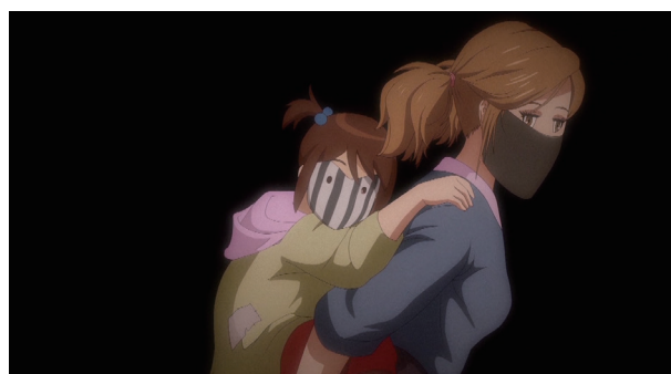
《易経四十九卦》(2020年)