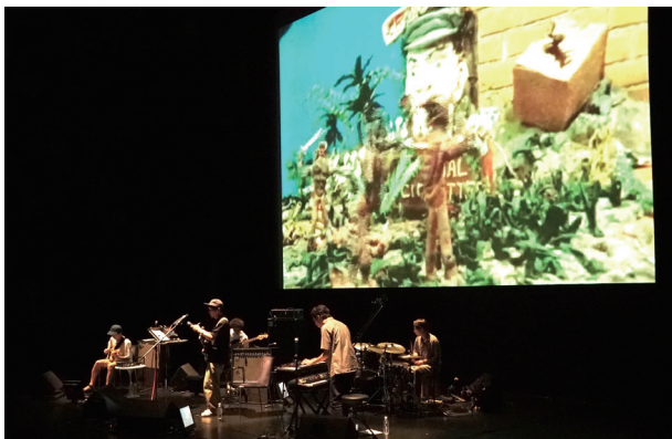
2016年に開催した「YCAM 爆音映画祭 2016」でのライブパフォーマンスの様子