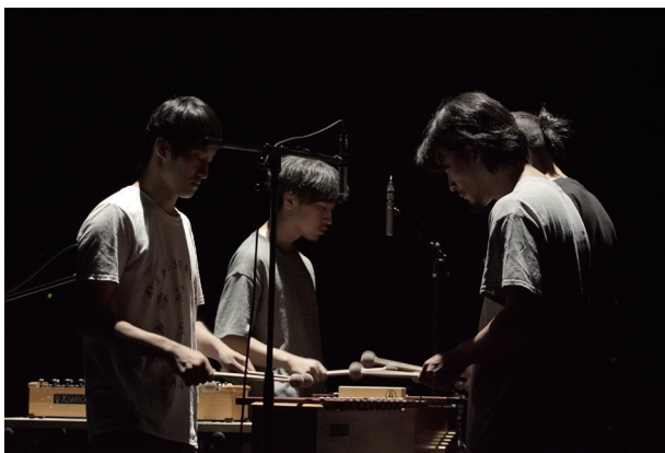
sound tectonics #21 (2018年)