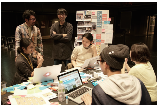
過去の集中ワークショップの様子 (2017年)