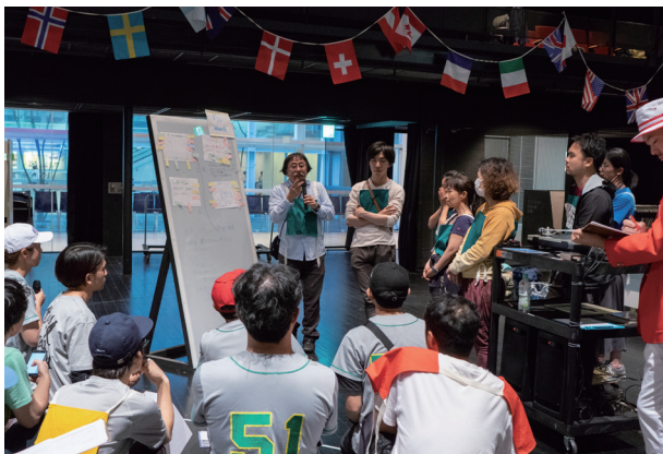
「YCAMスポーツハッカソン2018」にてデベロッパレイをおこなう参加者たち (2018年)