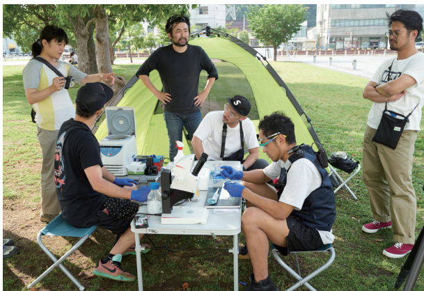
contact GonzoとYCAMバイオ・リサーチのメンバー