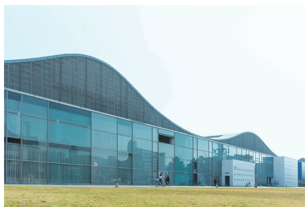
山並みの屋根が特徴的なYCAMの外観

これらのイベントを通じて、「ともに作り、ともに学ぶ」という活動理念の実現を目指すとともに、次世代を担う人材の育成を進めていきます。この機会にぜひご参加ください。