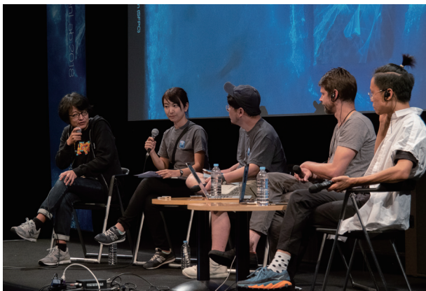
「YCAM オープンラボ2018」トークセッションの様子