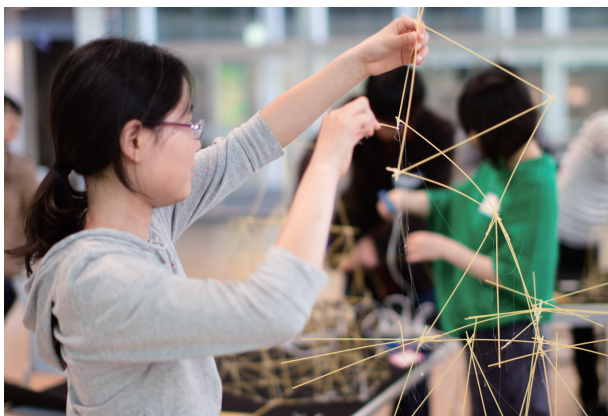
「パスタ建築」を体験する参加者 (2012年)