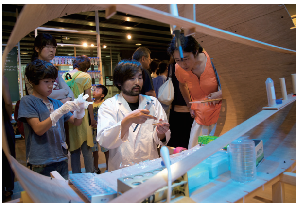
YCAMバイオ・リサーチ・オープンデイの様子 (2016年)