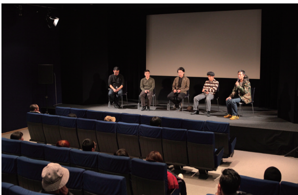
ゲストを招いてのトークイベントの様子(2017年/撮影:谷 康弘)