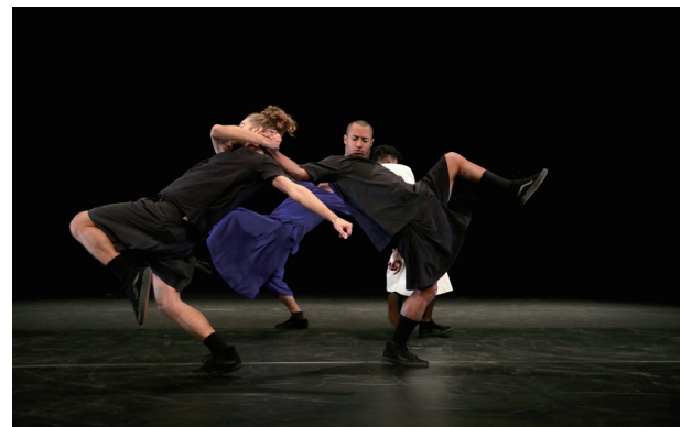
グルーポ・チ・フーア「イノア」(2017年)

この機会に、取材や記事掲載にご協力いただけますよう、よろしくお願い申し上げます。