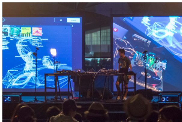
写真：WILD BUNCH FEST. 2017での「AI DJ PROJECT」の様子 (2017)

テクノロジーと組み合わせることで生まれる新しい音楽表現をぜひ、この機会にお楽しみください。