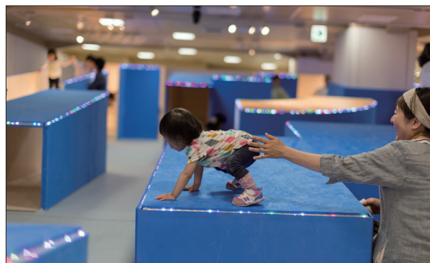
写真(上)：2012年にYCAMで発表した「コロガル公園」の様子 写真(下)：「コロガルガーデン for LIL KIDS」(2015年／東京・伊勢丹新宿店)

この機会に、取材や記事掲載にご協力いただけますよう、よろしくお願い申し上げます。