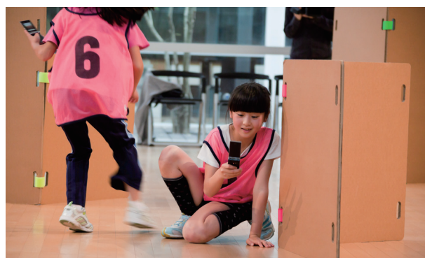
今回受賞したYCAMオリジナルワークショップの中から「感覚アスレチック」(上)と「ケータイ・スパイ・大作戦」(下)

この機会に、取材や記事掲載にご協力いただけますよう、よろしくお願ひ申し上げます。