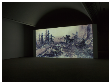
参考写真：向井知子による展示イメージ