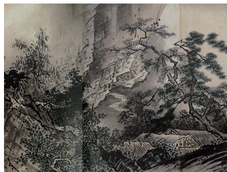
正式名称：「四季山水図」 通称：「山水長巻」 雪舟等楊筆 1486(文明18)年12月 原本：40.8cm×1602.3cm 毛利博物館蔵 国宝

本作は、山口が「西の京」と謳われる基礎を築いた大内氏第29代当主大内政弘の時代に描かれ、献上されたもので、大内氏の滅亡後は、毛利氏が所有し、以降毛利家により保存され、現在は毛利博物館に所蔵、毎年11月に公開されている。