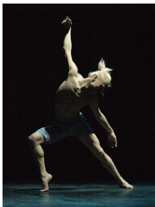
森山開次「Namida君vol.1」

これは、日本とオーストラリアを拠点に様々な芸術分野で意欲的に活動を繰り広げる、世代、文化背景が違うアーティストたちの、〈人生〉をテーマとした壮大な作品です。どうぞ、貴媒体にてご紹介いただけますよう、お願い申し上げます。