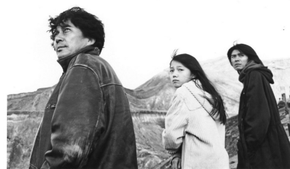
上映作品『EUREKA ユリイカ』