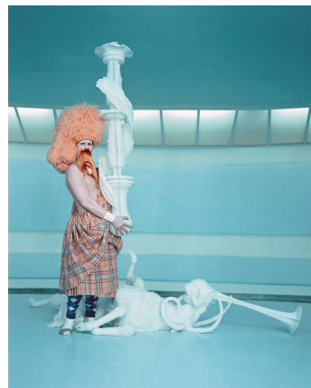
CREMASTER 3, 2002 Photo Chris Winget © Matthew Barney, courtesy Gladstone Gallery, New York and Brussels