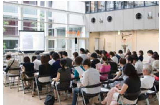
これまでのYCAM教育普及レクチャーの様子