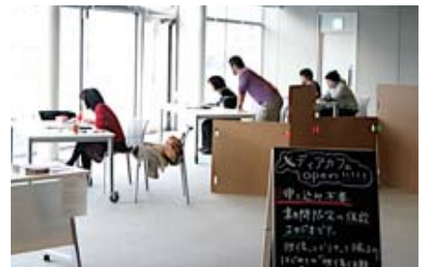
参考写真：これまでのYCAMワークショップの様子