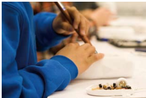
参考写真 YCAMオリジナルワークショップ「ハンドメイドマウス」(2009)