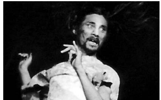
土方巽「肉体の反乱」