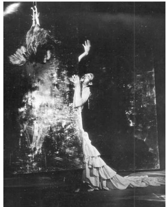
土方巽「肉体の叛乱」

1960年代に土方によって創始された暗黒舞踏は、「BUTOH」の名として世界中に伝播し、多様な芸術表現、幅広い世代へと影響を与え、現在の日本のダンスシーンにおいてもその軌跡を見ることができます。本特集では、土方の身体像を描写し、その時代背景までを感じさせる貴重な記録映像、土方の思想を伝えるテキスト、創作に携わった人物の語りから、土方の魅力と今日における土方の功績を考えます。貴重な映像記録とともに、もうひとつの記録である言葉を通じ、土方巽という、現代に続くイマジネーションの源泉をご紹介します。