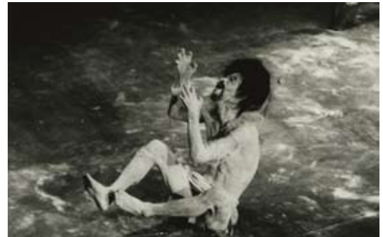
土方巽「瘡瘡譚」