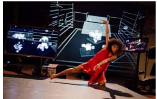
安藤洋子「Reacting Space for Dividual Behavior」(2011年)