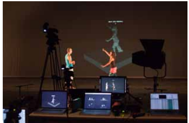
YCAMでの研究開発の様子(2011年)