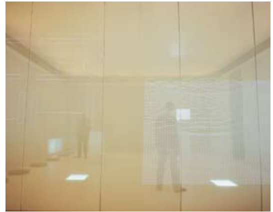
参考写真：「polar [ポーラー]」(キヤノン・アートラボ企画展、東京、2000)

1965年東ドイツ生まれ。現在、ベルリンとケムニッツを拠点に活動。ビジュアルアートと電子サウンドといった異なる領域の表現をハイブリッドツールとして用いる作品で知られる。その表現は、物理現象、生命現象、カオス現象などにもおよぶ。サウンドパフォーマンスでは、記号的なコードを視覚化し、ポストテクノ音響のみならず、現代美術やメディアアートでも国際的に高く評価されている。ミュージシャンとしては、notoおよびalva notoの名で、数々のアーティストとコラボレーションをおこなうほか、池田亮司とのユニットcyclo.としての活動でも知られる。2005年には、光と音と建築の共生体となるインスタレーション「syn chron」をYCAMにて発表。