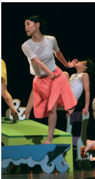
珍しいキノコ舞踊団「3mmくらいズレてる部屋」

ダンスカンパニー「珍しいキノコ舞踊団」とインタラクティブアートでの幅広い活動を繰り広げるメディアアーティストグループ「plaplax」が、1年間にわたって交流と実験を重ね、最終的には1ヶ月に渡るYCAMでの滞在制作で新作のダンス作品を作りあげます。2組のグループは、活動するジャンルが異なりますが、ポップでキュートな世界観では共通しています。この新しい出会いによって、メディアテクノロジーと舞台芸術との新しい可能性を探り、身体と映像がインタラクティブに作用する、実験的でありながら、どこかおしゃれなダンス作品が生まれます。