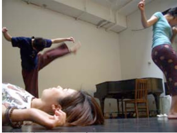
Small apple [山口]

2006年10月15日プレスリリース 山口情報芸術センター(YCAM) presents