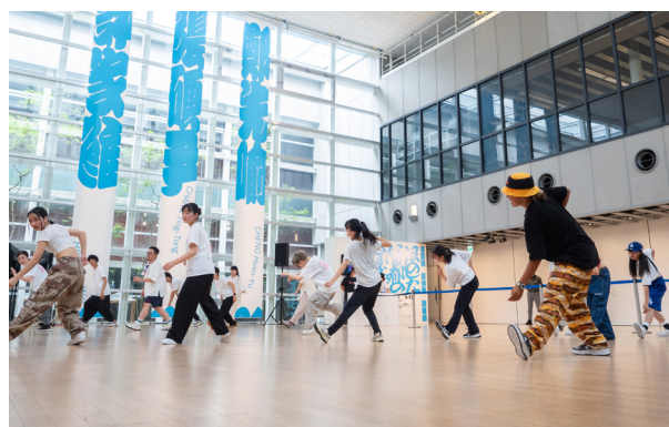
「メディア・テクノロジーでダンスをパワーアップするワークショップ」(2023年)

この機会に、取材や記事掲載にご協力いただけますよう、よろしくお願い申し上げます。