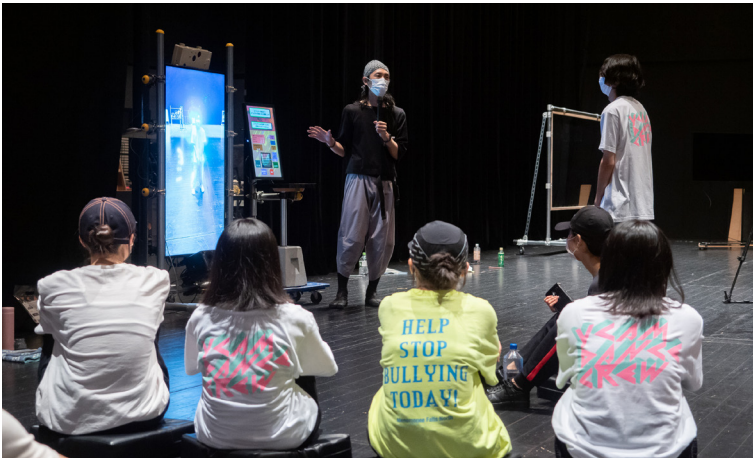
「メディア・テクノロジーでダンスをパワーアップするワークショップ」(2023年)

ダンスや演劇などのパフォーマンス作品の上演は、展覧会や映画上映と並ぶYCAMの活動の柱です。開館以来、国内外の優れた作品を紹介するとともに、アーティストとのコラボレーションを通じてメディア・テクノロジーの発展によってもたらされる身体表現の進化に注目しながら、新作の制作をおこなってきました。