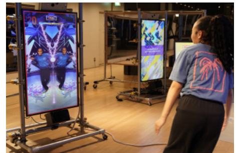
音楽に合わせてダンスしながらエフェクトを選択する。納得のいくダンスができれば録画する