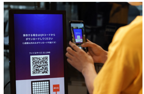
完成した映像をスマートフォンにダウンロードして、SNSでシェアする