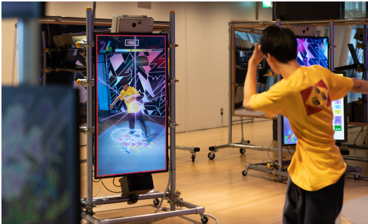
YCAM Dance Crewで開発した体験型ダンスブース（2021年）

本イベントでは、2021年に好評を得た体験型のダンスブースを再展示するとともに会期中盤の7月19日からはAI技術を使った新しいダンスブースを公開します。