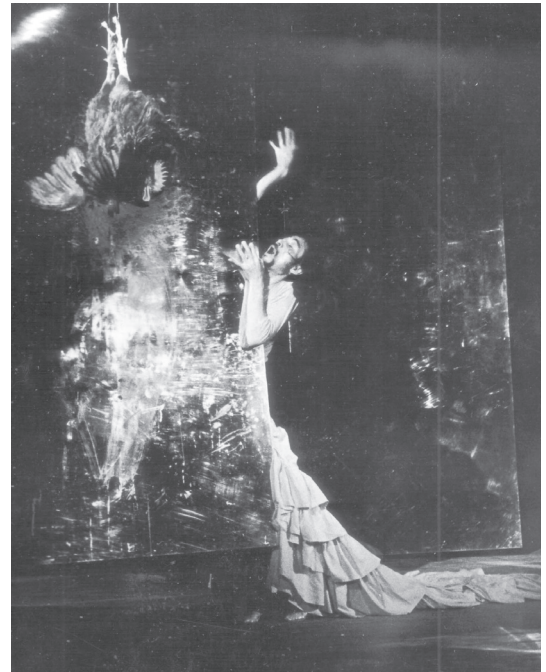
土方巽「肉体の叛乱」

1960年代に土方によって創始された暗黒舞踏は、「BUTOH」の名として世界中に伝播し、多様な芸術表現、幅広い世代へと影響を与え、現在の日本のダンスシーンにおいてもその軌跡を見ることができます。本特集では、土方の身体像を描写し、その時代背景までを感じさせる貴重な記録映像、土方の思想を伝えるテキスト、創作に携わった人物の語りから、土方の魅力と今日における土方の功績を考えます。貴重な映像記録とともに、もうひとつの記録である言葉を通じ、土方巽という、現代に続くイマジネーションの源泉をご紹介します。