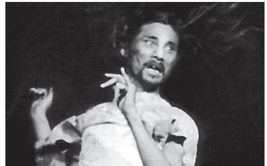
土方巽「肉体の反乱」