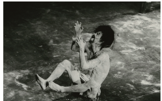
土方巽「瘡瘡譚」